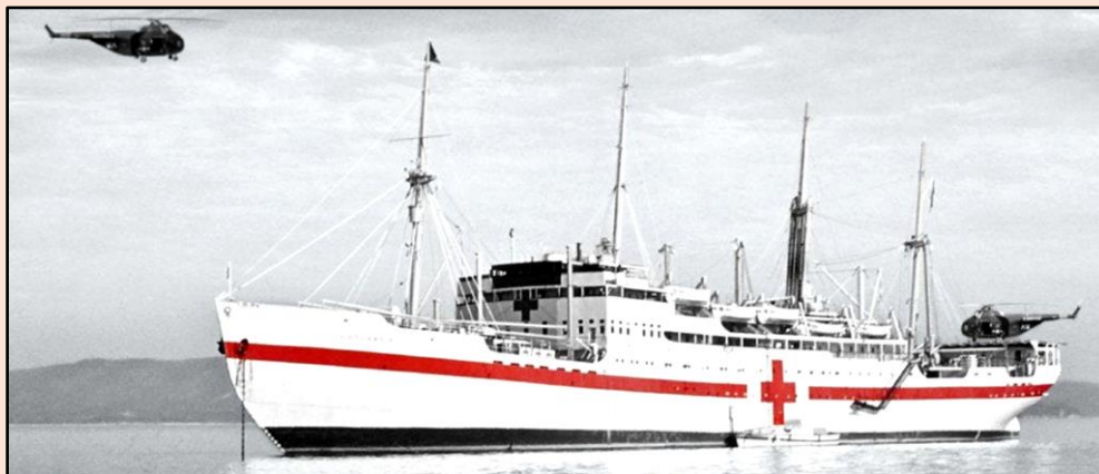
Hospitalsskibet JUTLANDIA i aktion ved Korea's kyst.